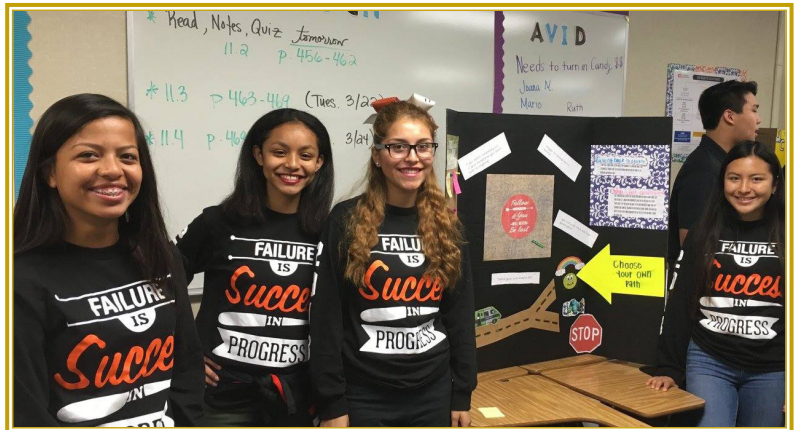
Học sinh Chương Trình AVID tại trường Trung Học Cấp 2 Los Amigos